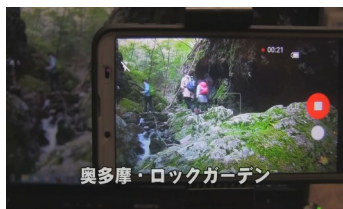
奥多摩・ロックガーデン