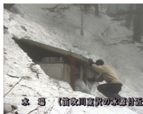
水場 (新沢川遺跡の水場付近)

いつ終息するか判らぬまま続くコロナ問題に悩む山小屋の人達を想い、運営の実情を紹介。